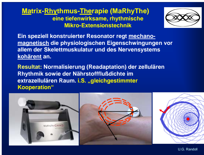
Abb.1: Links: Matrixmobil®; Mitte: Magnetisches Feld; Rechts: Spezifische harmonische Wellenform des Resonators die mechanisch in das Gewebe eingebracht wird und sich dort aufbaut.

Für die Mikrozirkulation, egal in welchem Organ im Körper, ist eine intakte, charakteristische Resonatorgüte der Skelettmuskulatur hauptverantwortlich.