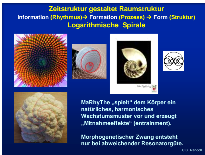
Abb.2: Die Therapie ist dann beendet, wenn kein „morphogentischer Zwang“ mehr besteht, d.h. die ursprüngliche Resonatorgüte der Gewebe wieder hergestellt ist.

Eine sanfte, harmonische Adaptation der Schwingungen an das Gewebe garantiert der patentierte Schwingkopf, sodaß die Gefahr von Bänderüberdehnungen bzw. der Resonanzkatastrophe bei inneren Organen grundsätzlich ausgeschlossen werden.